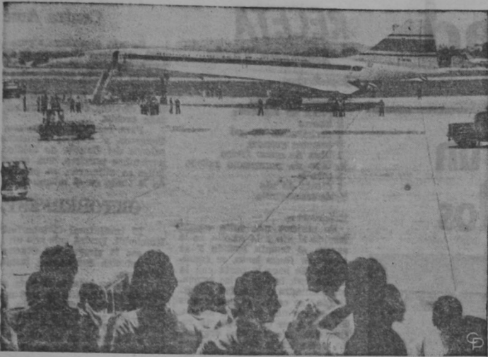
EL CONCORDE CRUZA EL ATLANTICO — Completando su primer vuelo transatlántico de Francia a Brasil, el jet supersónico anglo-francés Concorde es examinado por espectadores en Río de Janeiro. (Cablefoto).