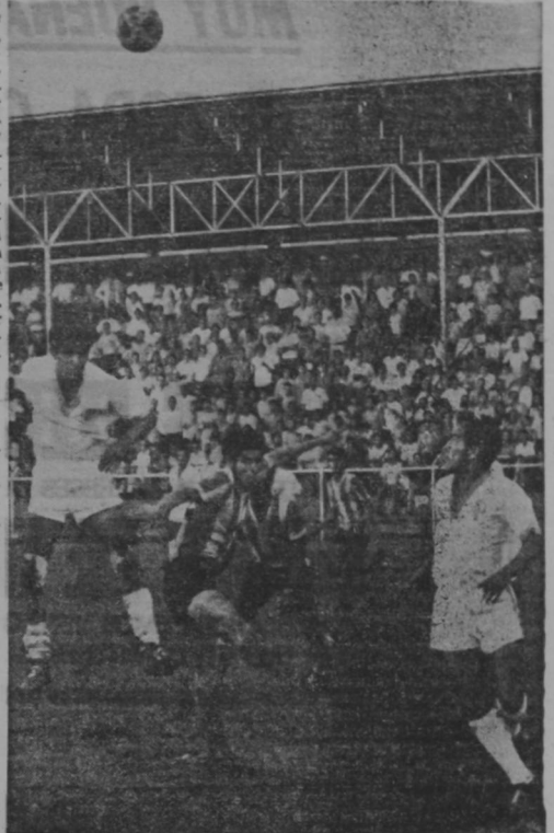
DEFENSORES puntarenenses y atacantes heredianos se confunden mientras la bola se eleva por los aires sin que ni unos ni otros logren controarla. Herediano remontó un marcador adverso y venció finalmente al Puntarenas 2-1