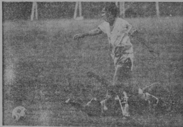
WANCHOPE resaba con un gesto de circunstancias al no poder alcanzar el cuero. El defensor puntarenense logra alejar el peligro de su zona.